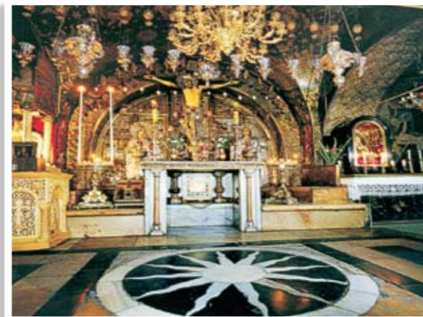
Ο φρικτός Γολγοθάς

Έντονη συγκίνηση αισθάνθηκαν οι προσκυνητές μας στη Γεθσημανή, όπου τοποθετήθηκε προσωρινά σε τάφο το σώμα της Παναγίας μας, μετά την Κοίμησή της. Και επειδή οι μέρες της εκδρομής συνέπιπταν με το παλιό εορτολόγιο, οι εκδρομείς μας βίωσαν την όμορφη θρησκευτική ακολουθία και την πομπή από την Γεθσημανή προς τον Πανάγιο Τάφο.