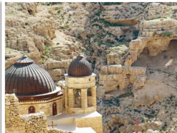
Αποψη του Καθολικού της Λαύρας του Αγίου Σάββα

Το πρόγραμμα της εκδρομής περιλάμβανε προσκυνηματικές επισκέψεις στην Ιερουσαλήμ, όπου κάθε της σημείο εκτυπώνει και διαμηνύει την παρουσία και τη θυσία του Χριστού, τη Βασιλική της Γεννήσεως του Χριστού στη Βηθλεέμ, με το χωριό των ποιμένων, την Λαύρα του Αγίου Θεοδοσίου του Κοινοβιάρχου και τη Μονή του Αγίου Σάββα, όπου ευρίσκεται θησαυρισμένο το ιερό σκήνωμα του Οσίου και όπου προσκυνά κανείς το λαξεμένο και άγιο κελί του Μεγάλου Πατέρα της Εκκλησίας μας Ιωάννου του Δαμασκηνού.