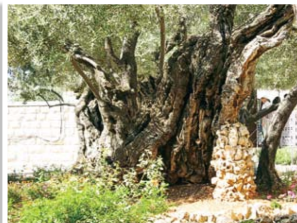
Το δένδρο της ελιάς, όπου κατά την παράδοση γονατιστός προσευχήθηκε ο Χριστός στη Γεθσημανή

Οπωσδήποτε μέσα στο πρόγραμμα της εκδρομής περιλαμβανόταν, μεταξύ άλλων, και η επίσκεψη στην περιοχή της Ιεριχούς, όπου και εκεί ο Κύριος θαυματουργήσε. Η συκομορέα του Ζακχαίου φέρνει ακόμα στη σκέψη και στην καρδιά των προσκυνητών τα λόγια του Χριστού: «Ήλθε γαρ ο υιός του ανθρώπου ζητήσαι και σώσαι το απολωλός». Αλλά και η άνοδος στο Όρος των πειρασμών του Κυρίου - το Σαραντάρι -, αποτέλεσε μια άλλη διάσταση των εμπειριών των προσκυνητών μας.