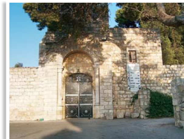
Ο ναός της Μεταμορφώσεως του Χριστού στην κορυφή του όρους Θαβώρ

Αναμφίβολα, αισθήματα ιερής συγκίνησης αποκόμισαν όλοι οι εκδρομείς «αναβαίνοντας εν τω Θαβωρίω», όπου ο Κύριος έδειξε στους μαθητές του, στο μέτρο που μπορούσαν να βιώσουν, ένα μικρό μέγεθος της θεότητάς του.