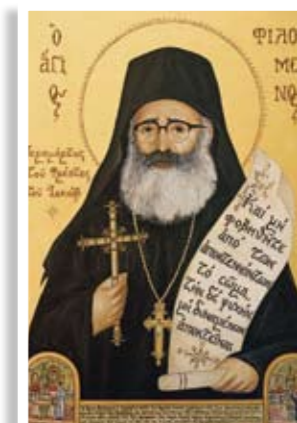
Ο Άγιος Φιλούμενος

Αναμφίβολα, αισθήματα ιερής συγκίνησης αποκόμισαν όλοι οι εκδρομείς «αναβαίνοντας εν τω Θαβωρίω», όπου ο Κύριος έδειξε στους μαθητές του, στο μέτρο που μπορούσαν να βιώσουν, ένα μικρό μέγεθος της θεότητάς του.