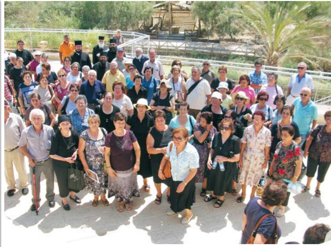
Αναμνηστικές φωτογραφίες των προσκυνητών μας στους Αγίους Τόπους