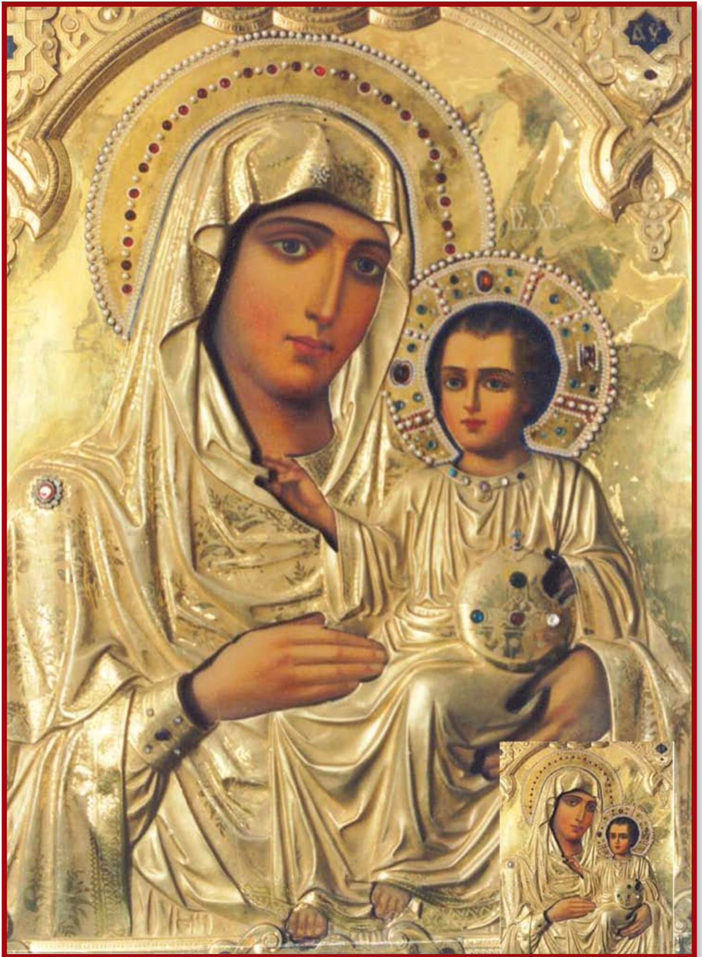
Η θαυματουργός εικόνα της Παναγίας Ιεροσολυμίτισσας