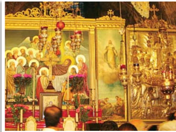
Ο Τάφος της Παναγίας

η αφιερωμένη στη Μάρθα και τη Μαρία, των αδελφών του Λαζάρου. Πιο πέρα ευρίσκεται ο τάφος του φίλου του Χριστού Λαζάρου.