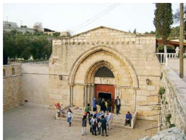
Η Βασιλική της Γεννήσεως του Χριστού, απότυπωση του Αστέρου (άνω δεξιά) και ο τόπος της Φάτης, που γεννήθηκε ο Χριστός (κάτω δεξιά)

Όποιος επισκέπτεται ως προσκυνητής τους Αγίους Τόπους, όχι μόνο θεωρεί την αγία αυτή γη ως τόπο δικό του, αλλά μέσα του αναβλύζει η επιθυμία να παραμείνει για πάντα στη γη αυτή, γιατί αισθάνεται ως παρόντα σε κάθε σημείο τον Κύριο.