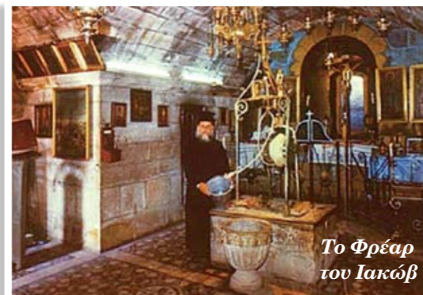
Το Φρέαρ του Ιακώβ

Συγκινητική από κάθε άποψη ήταν η επίσκεψη στο Φρέαρ του Ιακώβ, χώρο στον οποίο υπέστη μαρτυρικό θάνατο ο συμπατριώτης μας και πρόσφατα ανακηρυχθείς μάρτυρας Άγιος Φιλούμενος. Εδώ οι εκδρομείς κατέθεσαν με περισσή συγκίνηση τις προσευχές τους προς τον Άγιο Φιλούμενο, ώστε να μεσιτεύει προς τον Κύριο για τα προσωπικά τους θέματα αλλά και για την κοινή πατρίδα μας Κύπρο.