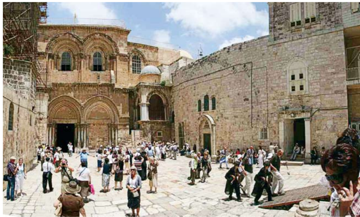
Αποψη από τον περίβολο του ναού της Αναστάσεως

Όποιος επισκέπτεται ως προσκυνητής τους Αγίους Τόπους, όχι μόνο θεωρεί την αγία αυτή γη ως τόπο δικό του, αλλά μέσα του αναβλύζει η επιθυμία να παραμείνει για πάντα στη γη αυτή, γιατί αισθάνεται ως παρόντα σε κάθε σημείο τον Κύριο.