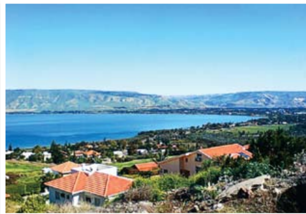
Η πόλη της Τιβεριάδος

Μέσα στην καρδιά της ερήμου η επίσκεψη στη Λαύρα του Αγίου Γερασίμου και η επικοινωνία με τον Ηγούμενο πατέρα Χρυσόστομο, ο οποίος έχει ιδιαίτερες σχέσεις με την Κύπρο, άφησε έντονες τις παραστάσεις.